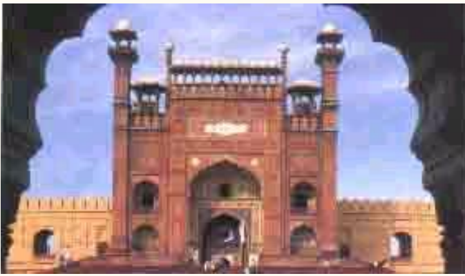
Mezquita de Badshai